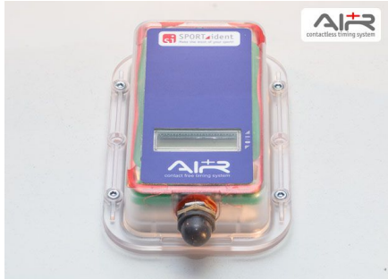
Foto: SI-jaam BS11-BS small

Kontrollpunktides asub puutevaba elektrooniline SI-jaam BS11-BS small (Vt https://www.sportident.com/products.html#stations ).